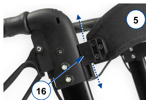
Obr. 3: Zasunutí/vysunutí zádového pásu

Chcete-li pás odebrat, povolte šroub a vysuňte koncovky nahoru, až se uvolní z drážek.