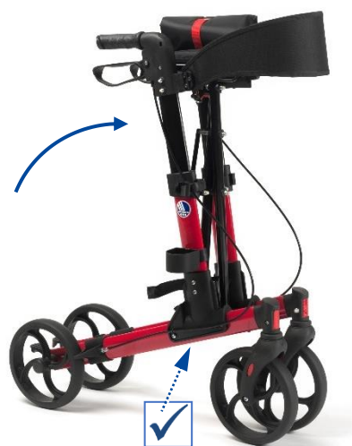
Obr. 1: Rozložení chodítka

i Před rozložením sedátka zajistěte, aby byly rukojeti zcela vzpřímené. Pokud tomu tak není, nelze rám úplně rozložit. Jde-li o tento případ, opětovným tahem za sedátko složete rám a zopakujte krok 2.