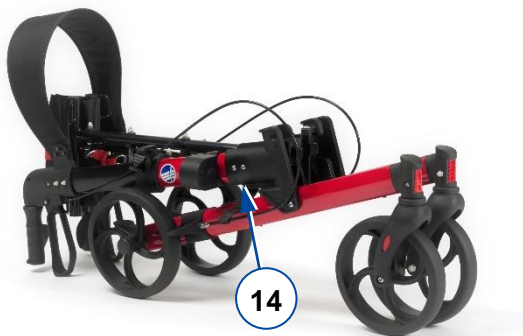
Obr. 2: Složení chodítka